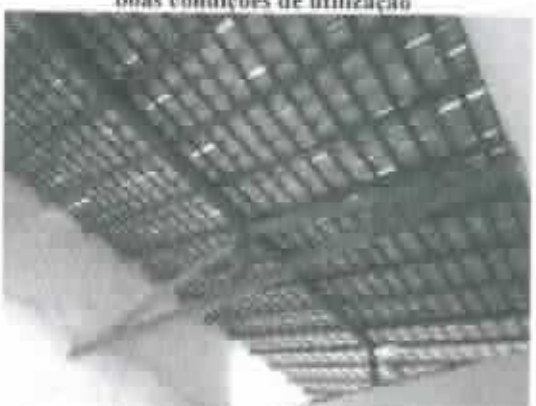
Figura 10 - Detalhe do telhado e madeiramento apresentando boas características - Área das salas de aula