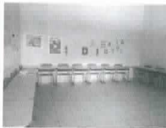
Figura 4 - Piso da sala sem presença de desgaste