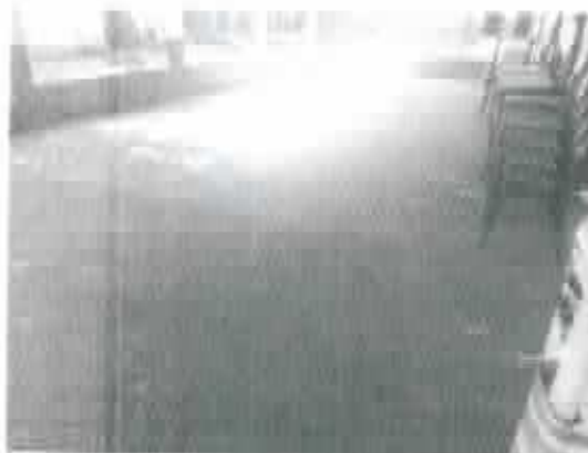
Figura 1 - Piso cimentado do pátio externo

h) O telhado é novo, não apresentando goteiras, aparentemente,