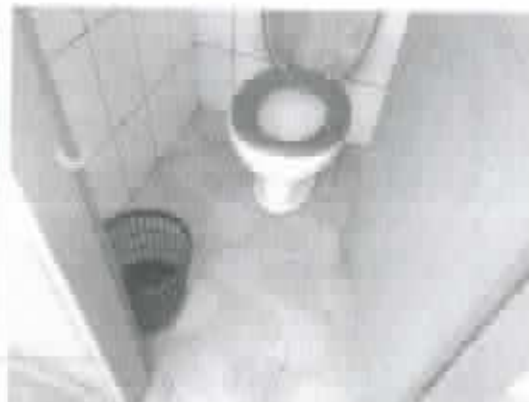
Figura 2 - Piso cerâmico do banheiro em boas condições de uso