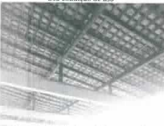
Figura 9 - Detalhe do madeiramento e do telhado apresentando boas características - Área externa