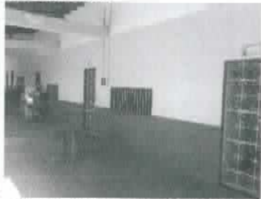
Figura 6 - Paredo e esquadrias metálicas das salas - Lado externo