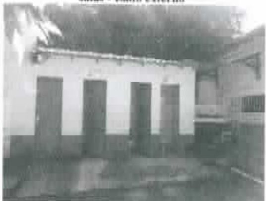
Figura 8 - Detalhe dos banheiros apresentando boas condições de utilização