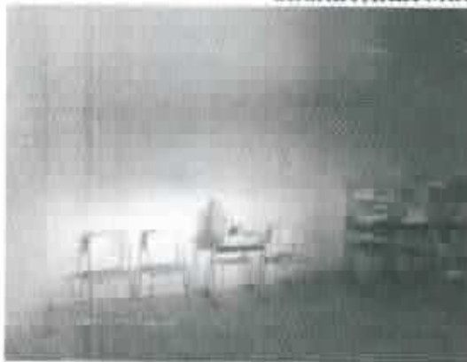
Figura 5 - Paredo de sala sem presença de infiltrações