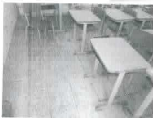
Figura 3 - Piso da sala apresentando desgaste devido uso