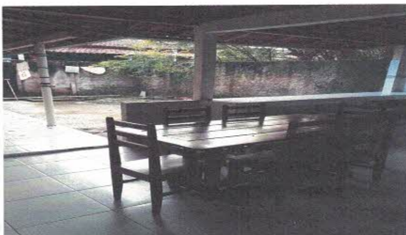
Figura 3- Área do fundo da edificação

LOCAL: Trav. Duque de Caxias , S/N, Centro, Nova Timboteua- Pará.