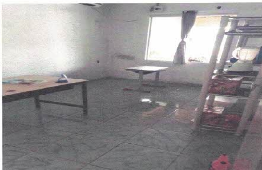
Figura 4.- Sala da edificação