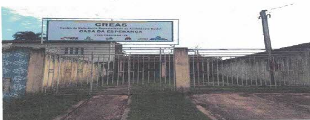
Figura 1- Vista frontal da edificação