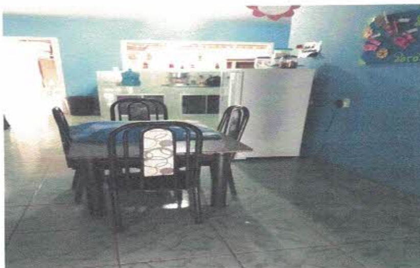
Figura 2- Copa da edificação